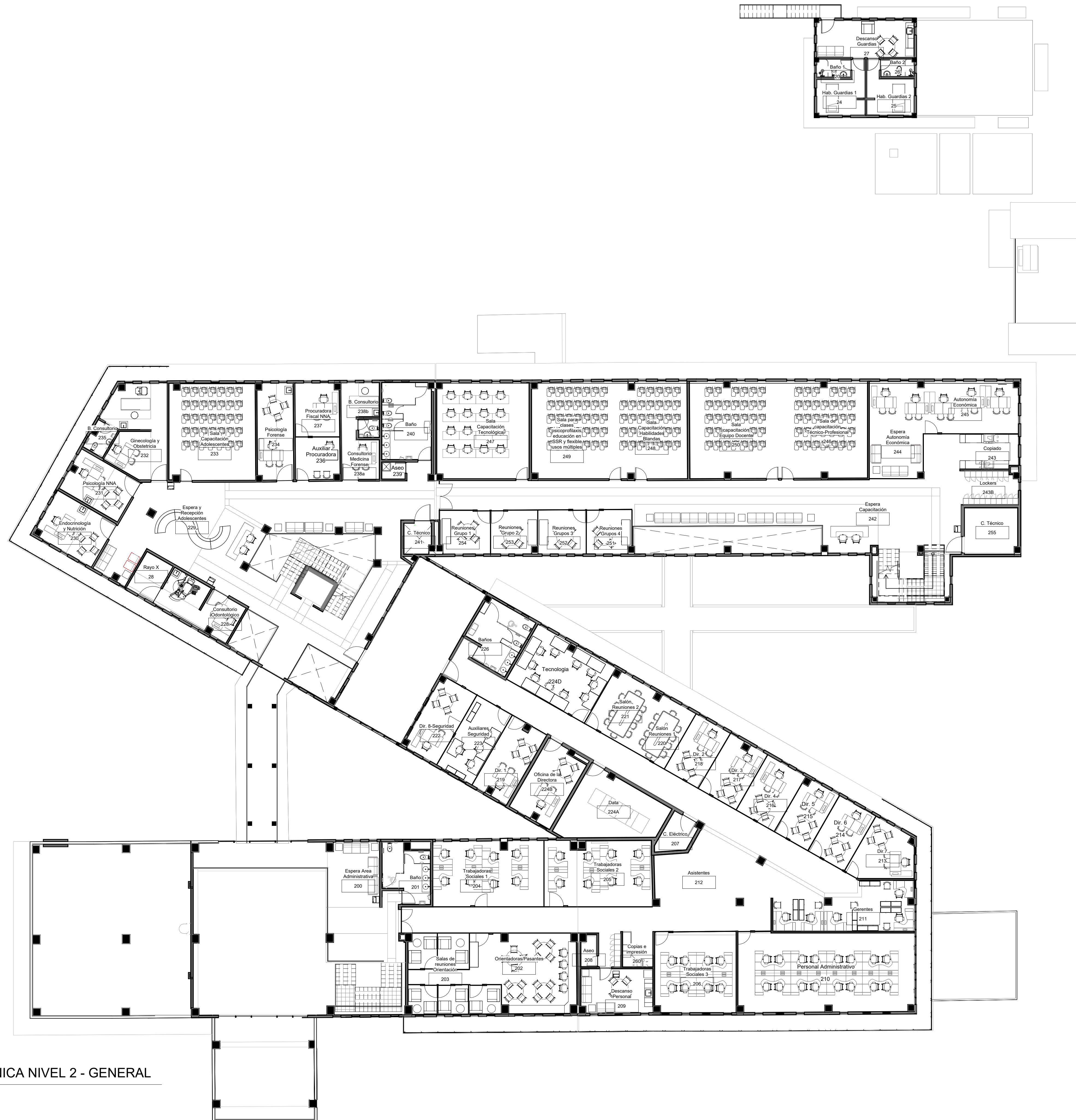
1 PLANTA ARQUITECTÓNICA NIVEL 2 - GENERAL ESCALA 1:150